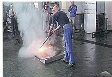
噴射時間は18秒ほどです。