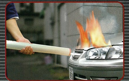
エンジンルームの火災