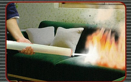
クッションの火災