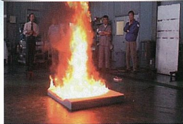
「消防法に規定されたクッション火災」