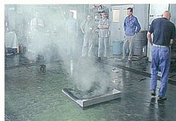
完全に消火できました。